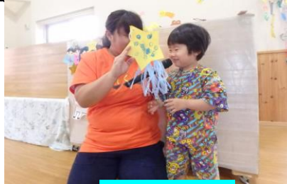
2016年度卒園児 どんぐり同窓会!