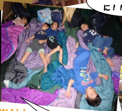
素晴らしいほ どの寝相(笑)