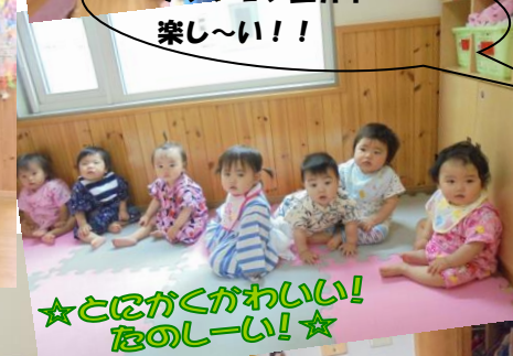
☆とにがくがわいい! たのし〜い! ☆