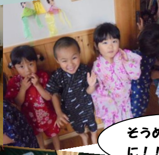
そうめん、おさき に!!