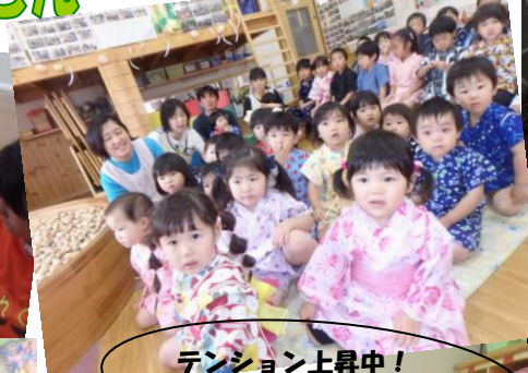
テンション上昇中! 楽し〜い!!