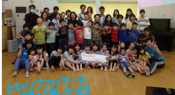
☆キャンプファイヤー☆ 歌って踊って楽しかった!!